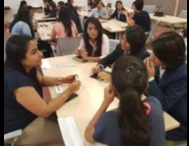
Accueil d'étudiantes dans l'IT par Orange Business en Inde