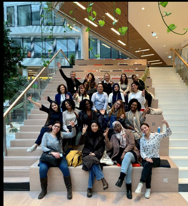
Visite de Sistech au siège d'Orange 9 mars 2023

Partenariats Hello Women : partenariat avec Sistech (accompagnement de femmes réfugiées), projet Heya Back to Work en Egypte (formation en ligne pour des mères de famille), projet Tech for Her au Maroc (parcours de reconversion interne et externe)